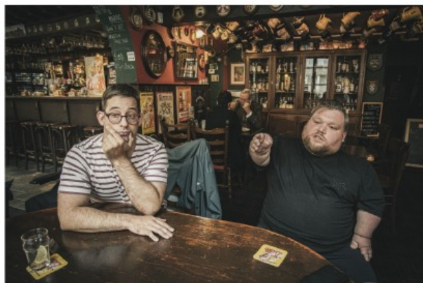
Boeva: 'De media hebben goede bedoelingen, maar we zitten niet mee aan tafel.'